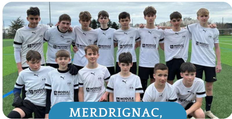
MERDRIGNAC, LA SECTION SPORTIVE

Nous les félicitons pour le parcours réalisé.