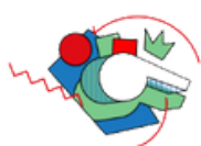
RÈGLES DU JEU ARBITRAGE